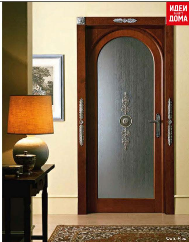
ИДЕИ ВАШЕГО ДОМА

↑ → На производстве арочных дверей, в том числе из массива дерева, специализируются лишь очень немногие компании, среди которых Flex и Legnoform