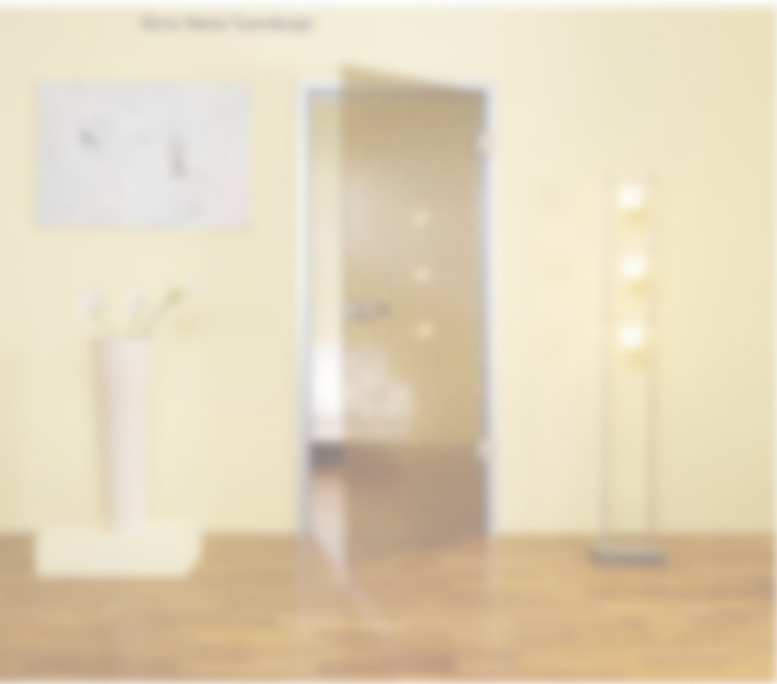
В. В. При выборе стандартной двери следует учесть высоту потолка помещения — стандартная высота потолка в квартирах составляет 2,4 м. При выборе нестандартной двери следует учитывать высоту потолка помещения.