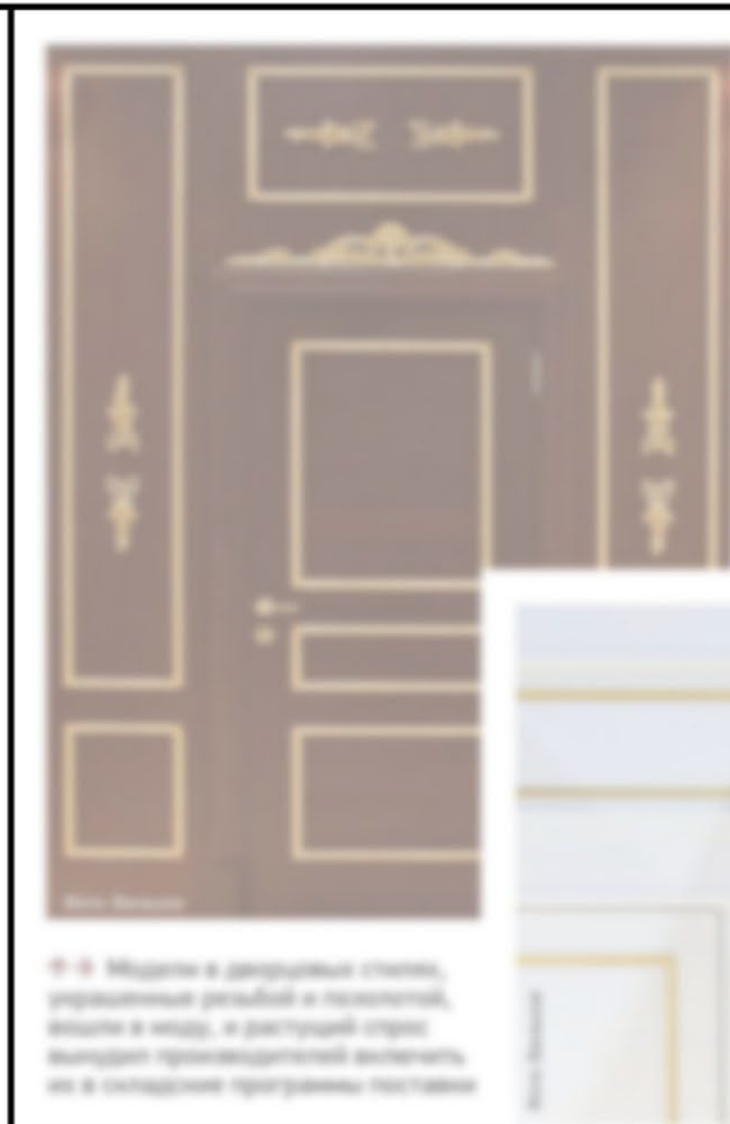
↑ → Модели в декоративном стекле, украшенные резьбой и позолотой, вставы в металл, и различные стили выдают премиальный уровень, но в соответствии программы поставки

4 ДВЕРЦА ДЛЯ ДОМАШНЕГО ПИТОМЦА с подвесной створкой (pet door). Обычно выполняется из пластика и может быть врезана практически в любое щитовое полотно над нижним бруском обвязки (то есть на высоте около 6 см от пола). Цена — от 2500 руб.