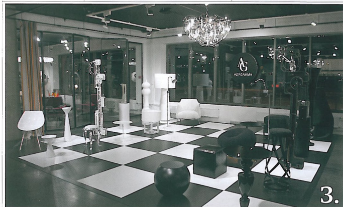
3. ИНСТАЛЛЯЦИЯ В ГАЛЕРЕЕ ДИЗАЙНА